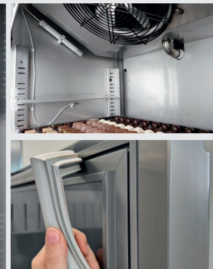
Doors equipped with easy-to-replace interlocking magnetic gaskets. Leicht wechselbare Türmagnetsteckdichtungen. Двери имеют магнитные шпунтовые уплотнители, которые легко заменяются.