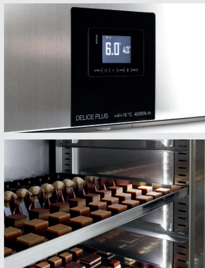
Led lights in the glass door version. Inkl. LED-Leuchten in der Version mit Glastür. Светодиодное освещение в версии с стеклянной дверей.