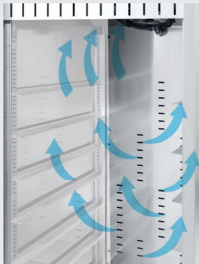
"Gentle" refrigeration: Perforated back for indirect airflow. "Schonende" Kälte: Indirekter Kaltluftstrom dank der gelochten Innenrückwand. "Мягкой" холод: задняя часть с отверстиями для однородного движения воздуха.

Набор для проверки влажности внутри шкафа через электронного датчиком для точные измерение относительной влажности