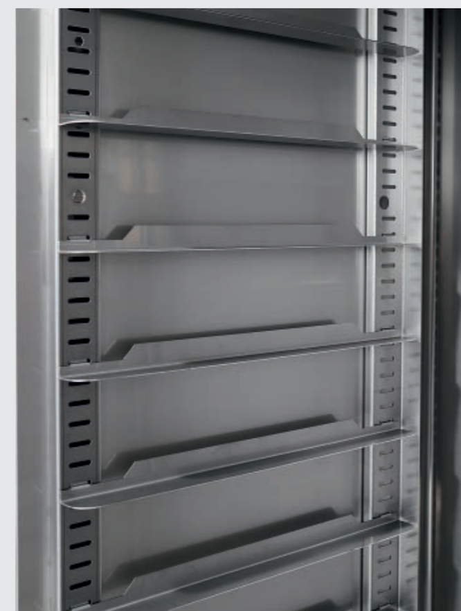
Racks with easily removable runners with 74 positions (16,5 mm pitch). 74 Einschubpositionen (16,5 mm Abstand) Rasterleiste mit leicht herausnehmbaren Auflageschienen. Стойки с направляющими которые легко перемещаются. Расстояние между лотками 16,5 мм и 74 возможные позиции.